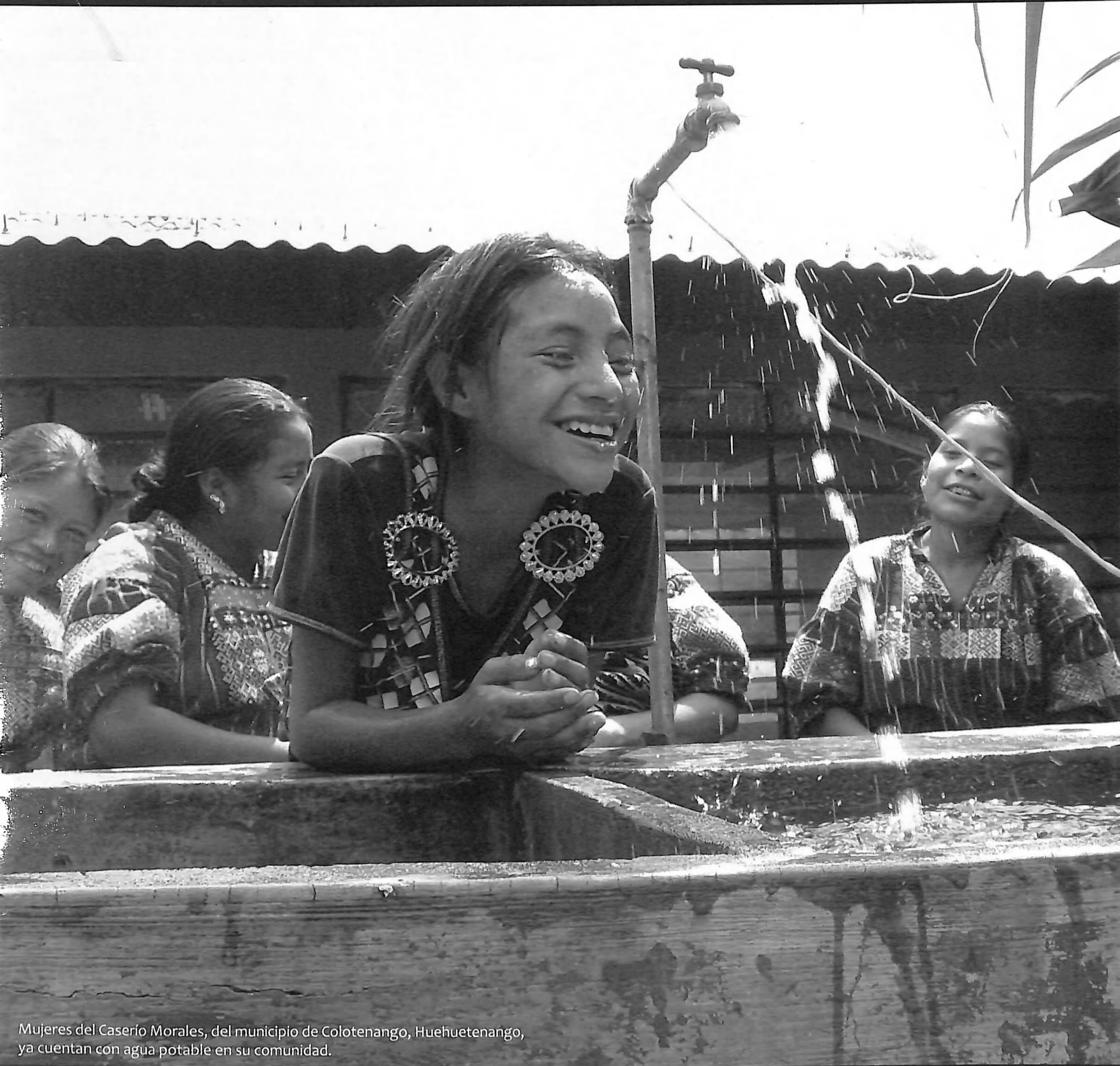
Mujeres del Caserío Morales, del municipio de Colotenango, Huehuetenango, ya cuentan con agua potable en su comunidad.