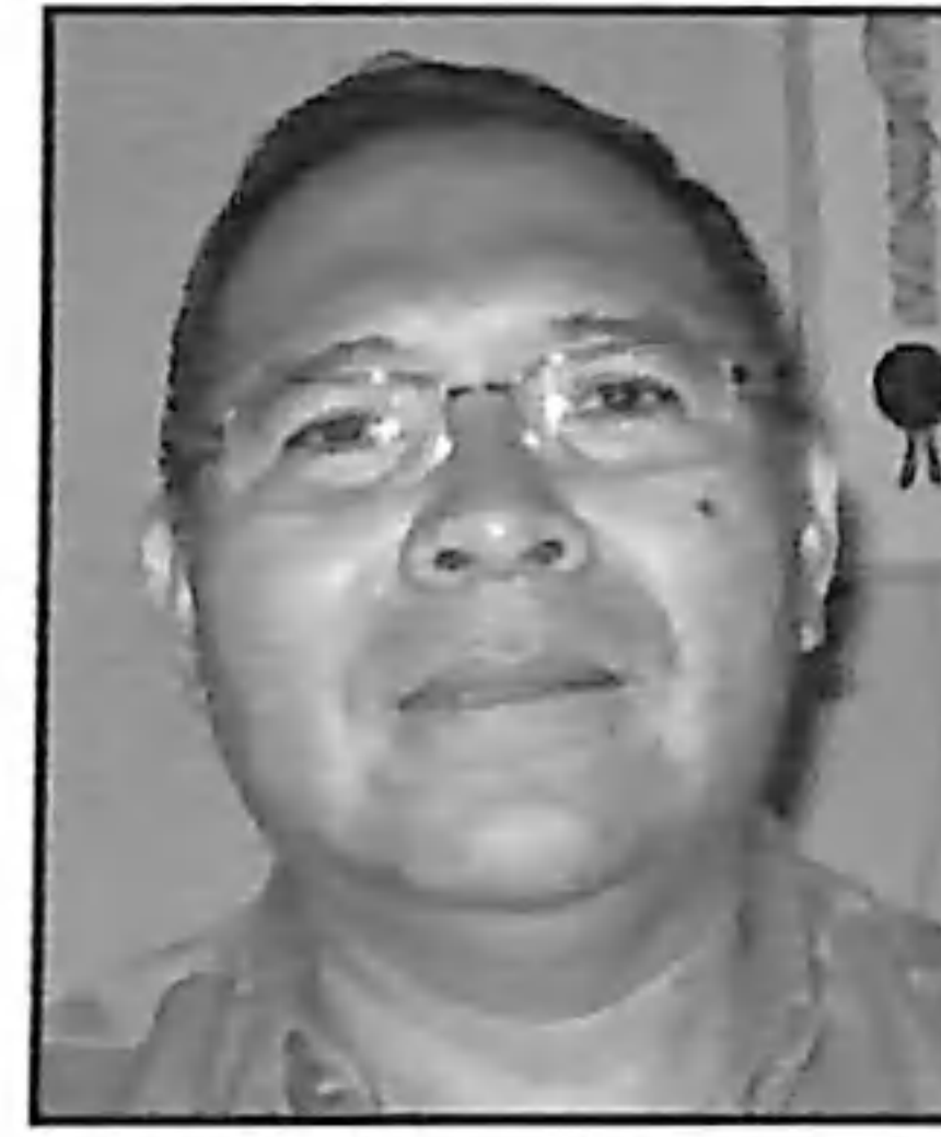
Rudy Cardona Gobernador de Huehuetenango

Opiniones sobre la importancia del apoyo del PDRL en Huehuetenango.